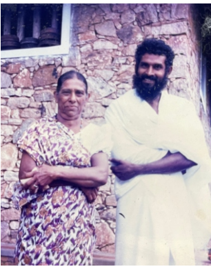
පැවිදි විමට පෙර මව සමග

පැවිදි විමට ලද අවස්ථාව පිළිබඳව මවට දැනුම් දුන් ලිපිය