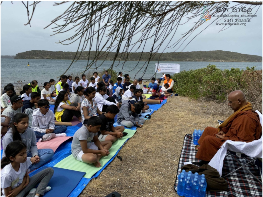
2019 ඔස්ට්‍රේලියාවේ සිඩ්නි නුවර සතිපාසල් කඳවුරේ දී