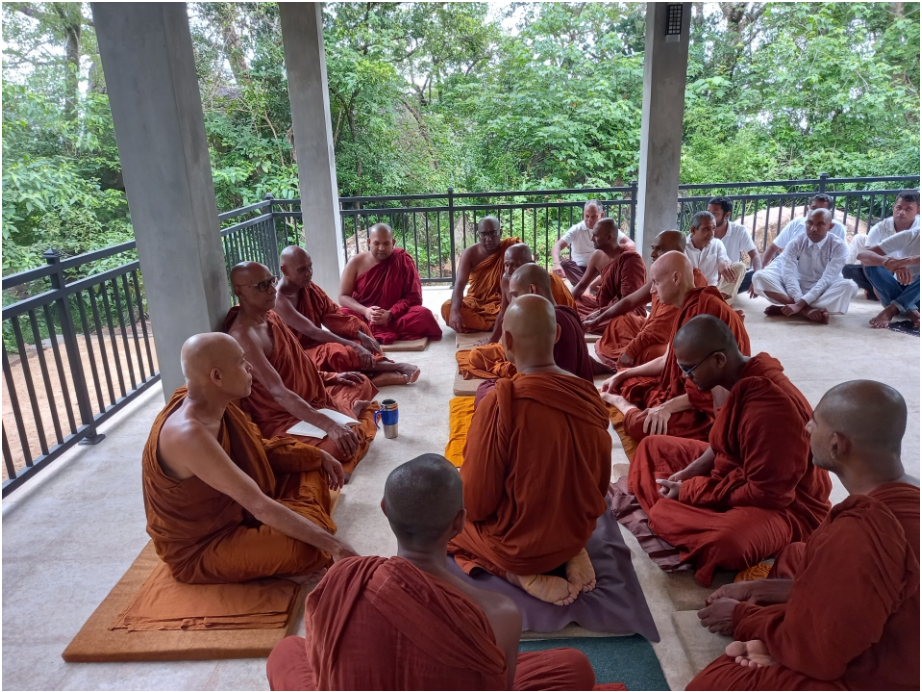
විජිතපුර දුටුගැමුණු ආරණ්‍ය සේනාසනයේ සීමා මාලකයේ දී