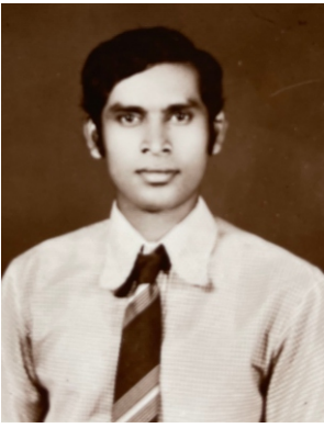
තරුණ අවදියේ දී..